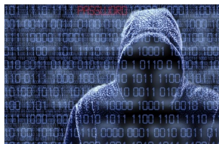
Popis obrázka alebo grafického prvku.